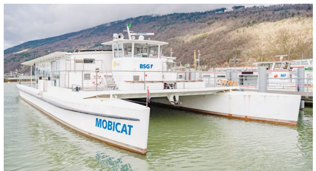
La saison estivale de la BSG commence dimanche avec un brunch sur le catamaran solaire Mobicat.

En raison des mesures de protection liées au coronavirus, le nombre de places à bord est toutefois limité. Les coordonnées de tous les passagers sont répertoriées et serviront à retracer les chaînes de transmission. «Afin d'éviter au maximum de longues attentes lors de l'embarquement, nous prions nos clients d'apporter la feuille de données